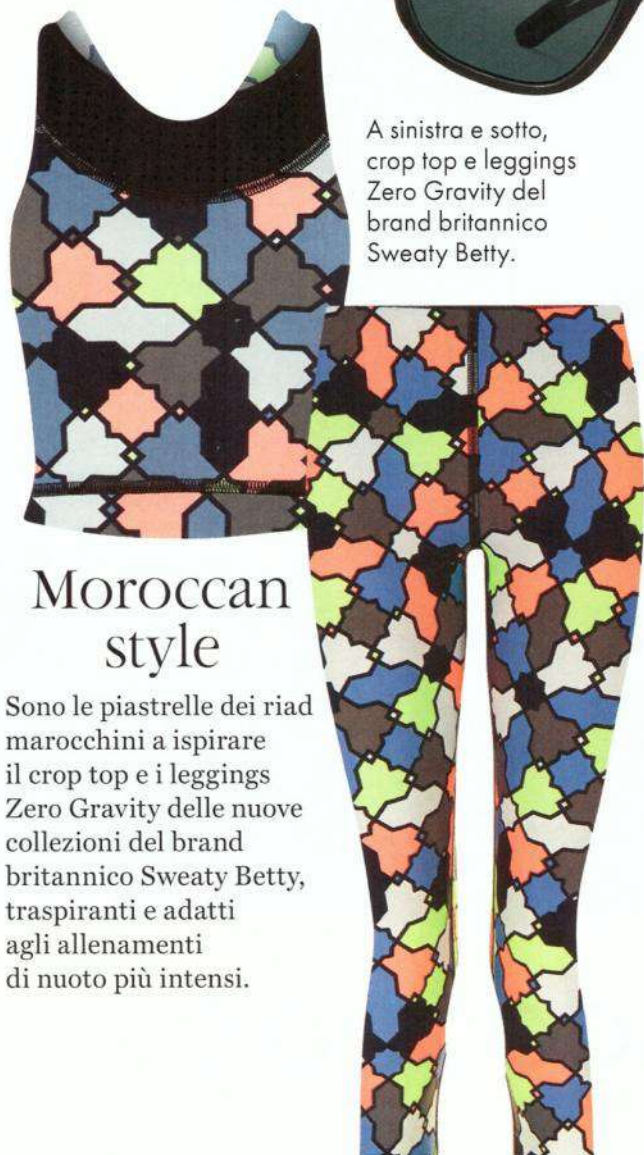
A sinistra e sotto, crop top e leggings Zero Gravity del brand britannico Sweaty Betty.