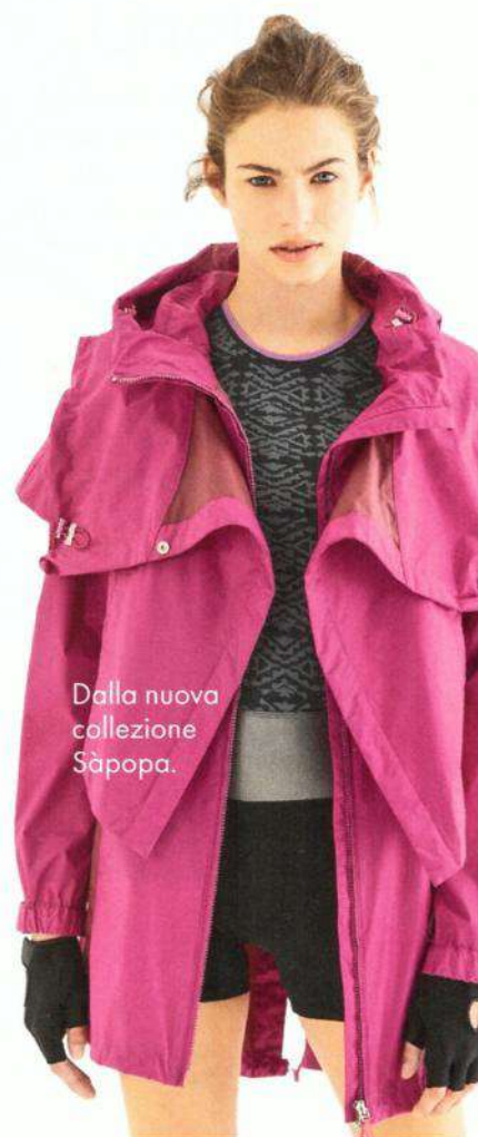
Dalla nuova collezione Sàpopa.

Grafica, multifunzionale, sofisticata. L'ultima collezione di Sàpopa esalta il concetto dello sport-à-porter trasferendo le lavorazioni sartoriali sui materiali e sui tessuti tecnici dell'alta performance. L'immagine è ricercata, dinamica, trasversale, in equilibrio tra la dimensione atletica e lo spirito fashion. T-shirt con coulisse silhouettanti e tute pjiama-style realizzate nel tessuto Seamless, morbido e fluido.