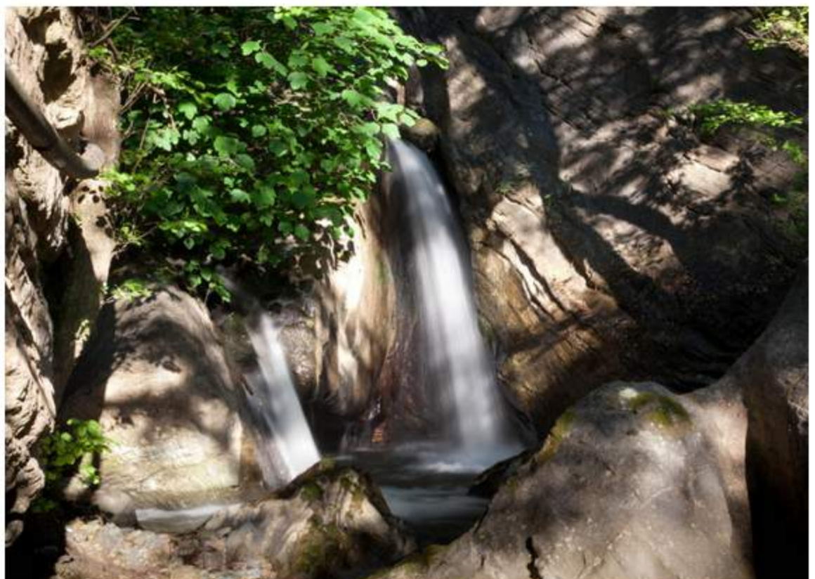
Rigenerarsi con il fango di Calabria

Immerso in un'autentica foresta esotica, nel cagliaritano, il Forte Village Resort stupisce per la location, oltre che per i 27 ristoranti, i 7 hotel e l'inedito centro talassoterapico. L'acqua marina è la protagonista indiscussa del paradiso wellness dell'Acquaforte Spa: un'oasi "galleggiante" immersa nel verde, da scoprire in un percorso a sei vasche, ognuna con un plus detossinante quanto rigenerante. Solo qui capita di sentirsi leggeri come una piuma una volta immersi nella vasca all'olio di mare (ad alta concentrazione di magnesio), di rigenerare la pelle con un bagno all'aloè o allontanare le ansie con il talassomassage in acqua. Vasta la varietà dei trattamenti: dallo shiatzu in cabina alla fisioterapia riabilitativa alla crioterapia all'olio di mare (50 minuti), ideale per contrastare cuscinetti e accumuli adiposi, sfrutta una sostanza congelata a meno quaranta gradi che viene applicata dove necessario con un bendaggio.