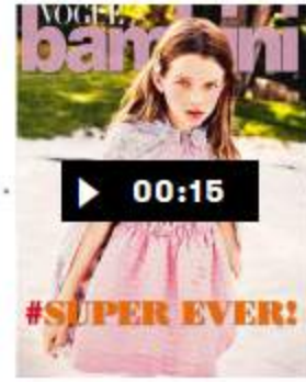
See you tomorrow!