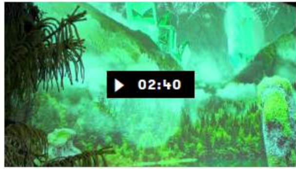
Salone del Mobile 2017: Visionnaire, re-evolution dal cuore verde