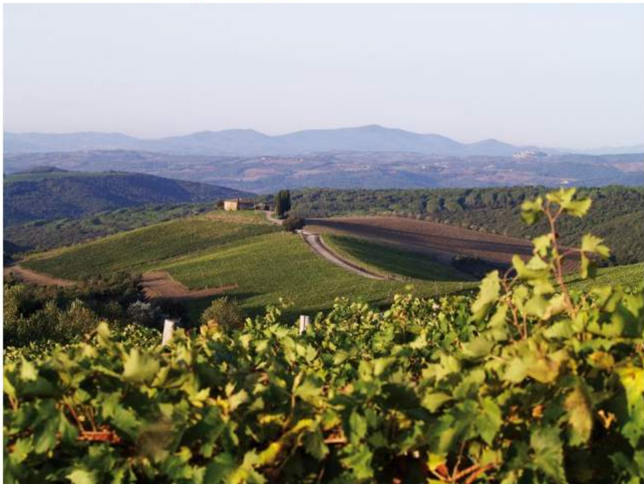
Rosewood Castiglion del Bosco