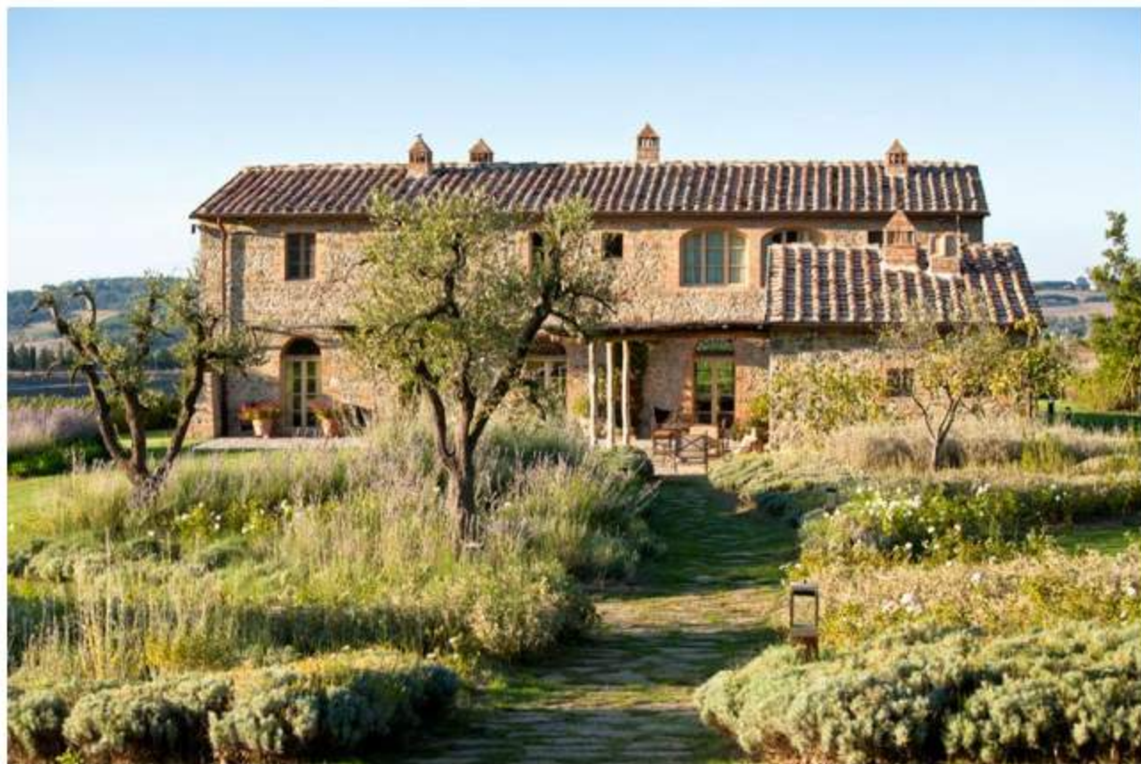
Rosewood Castiglion del Bosco