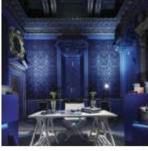
Bottega Veneta: una fluida eleganza