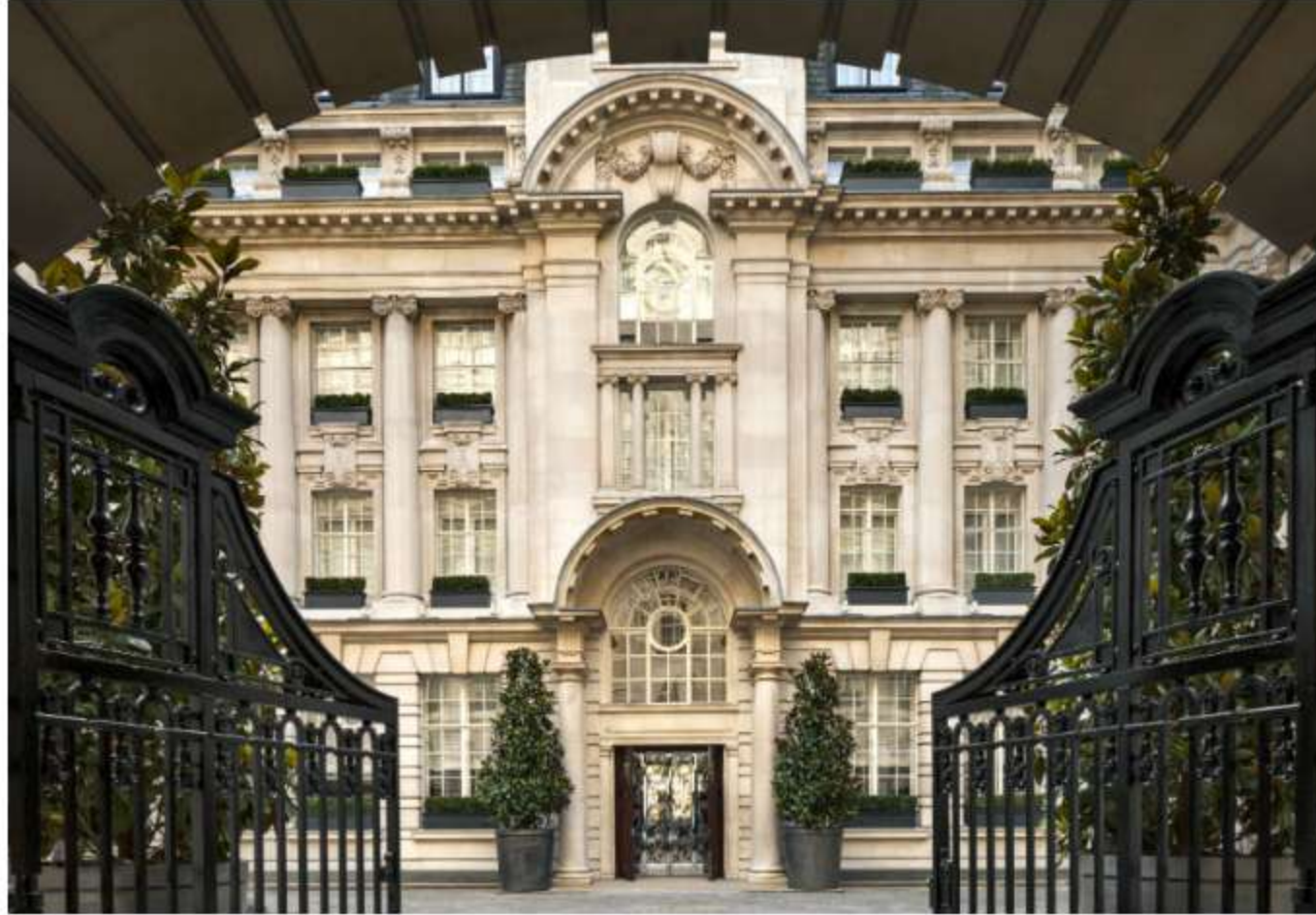
Rosewood London Entrance Wrought Iron Gates

Gli ospiti arrivano a Rosewood London superando un arco che si apre in un grande cortile edoardiano, una piccola oasi di tranquillità unica tra gli alberghi di lusso a Londra. È l'inizio perfetto per un soggiorno indimenticabile in uno spazio di eredità senza tempo, situato a pochi passi da Covent Garden e dal British Museum.