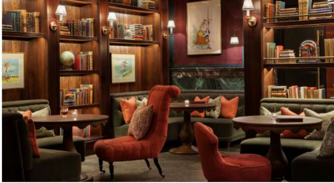
Scarfes Bar Current Affairs Corner

Rosewood London è il principale partner alberghiero per il Frieze London, l'evento d'arte contemporanea dell'anno che si svolge nel Regent's Park e dispone di oltre centosessanta opere delle gallerie più prestigiose del mondo.