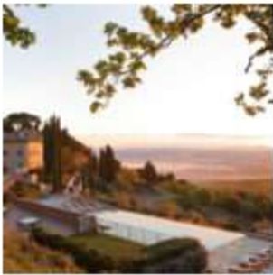
Rosewood Castiglion del Bosco: un racconto di storia tra le terre di Montalcino