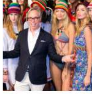
L'America di Tommy Hilfiger per le vie di Londra