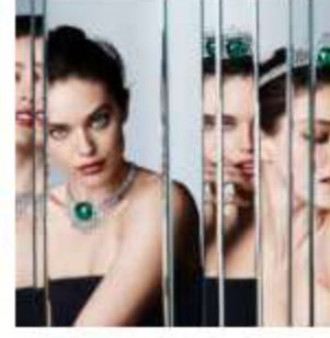
Résonances de Cartier - A Londra si apre il sipario dell'alta gioielleria