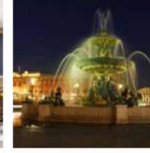
Nuovi balli alla corte di Maria Antonietta: a Parigi la riapertura dell'Hôtel de Crillon a Rosewood Hotel