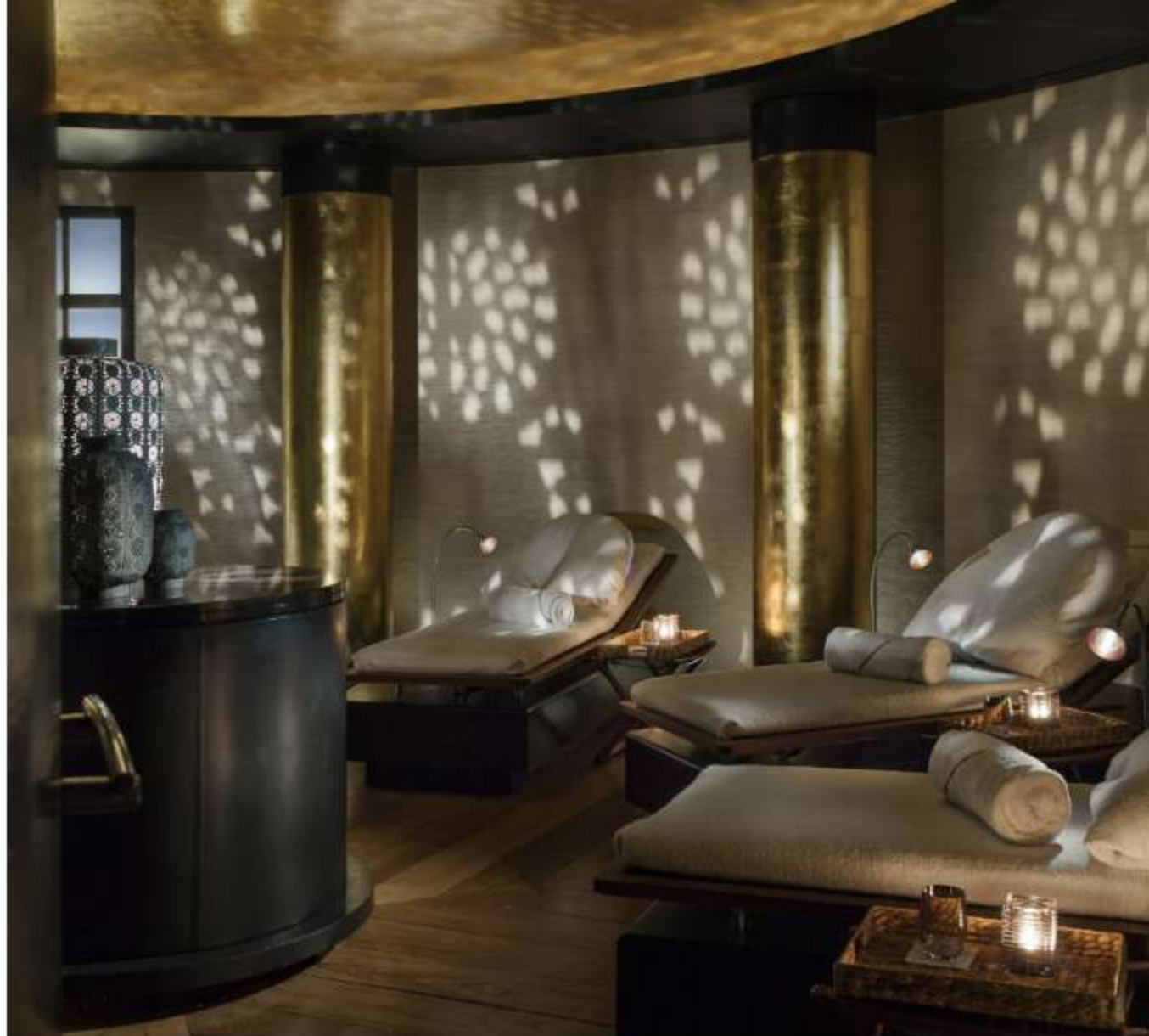
Sense Spa Rosewood London Relaxation Lounge

Le strutture includono saune con vapore a secco, camere di vapore ametista e un salotto di lucida foglia d'oro e teak che fornisce un rifugio di gran classe nel cuore di Londra. Esclusivi sono anche i trattamenti per i capelli a cinque stelle dal pluripremiato stilista Matthew Curtis, all'interno di un salone intimo e boutique nella Sense Spa.