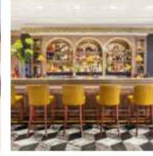
Il "The Arts Club", un luogo di cultura nel cuore di Londra