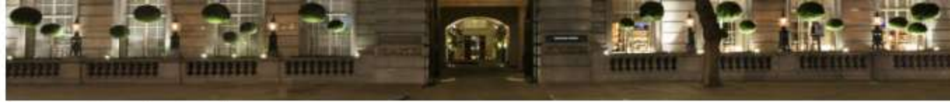
Rosewood London Exterior

Gli ospiti arrivano a Rosewood London superando un arco che si apre in un grande cortile edoardiano, una piccola oasi di tranquillità unica tra gli alberghi di lusso a Londra. È l'inizio perfetto per un soggiorno indimenticabile in uno spazio di eredità senza tempo, situato a pochi passi da Covent Garden e dal British Museum.