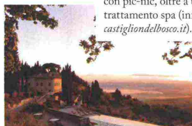
La tenuta Castiglion del Bosco , a Montalcino.

Una giornata tra i vigneti toscani, nel cuore della Val d'Orcia. Nella tenuta Castiglion del Bosco torna la Harvest Experience : dal 15 al 29 settembre, tre notti con colazione e una giornata fra le vigne con pic-nic, oltre a un trattamento spa (info castigliondelbosco.it ).