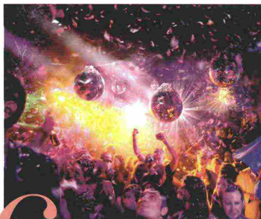
Dalla serie Konfettinacht di Carolin Saage (2007).

Una femme fatale ... dallo stile hi-tech? Per le sue serate mondane, si ispirerà ad atmosfere effetto Matrix: scegliendo un accessorio dalle cangianti sfumature. La vinilica borsa "Galassia" di Sara Giunti, per l'autunno, vanta riflessi titanici e vezzosi decori di piume colorate: (cyber) charme.