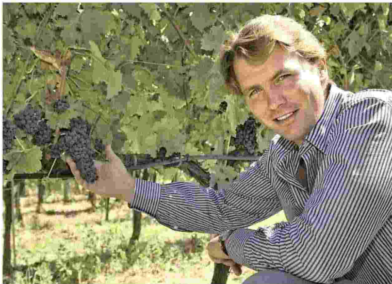
Salvatore Ferragamo in una delle sue vigne dove produce un vino di successo

«Abbiamo scelto questa strada per una questione di responsabilità. Oggi si parla tanto, e giustamente, di ambiente, un tema cru-